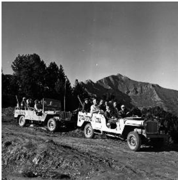
Jeeps d'excursió amb turistes.