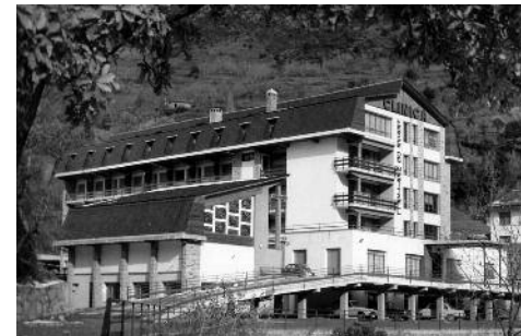
La Clínica Meritxell.

Article aparegut a La Vanguardia Española l'11 de març del 1967