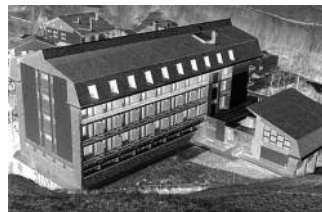
La Clínica Meritxell.

Así, pues, queda mucho aún por hacer dentro de nuestras cordilleras. No basta este bienestar social y económico un tanto pasajero que, de no poner los medios necesarios, puede esfumarse en cosa de años y hasta de meses. No obstante, cabe reconocer la magnífica labor de todos los que han comenzado esta supervisión de las actuales estructuras, aportando su interés y esfuerzo para la consecución de un patrimonio colectivo perfecto.