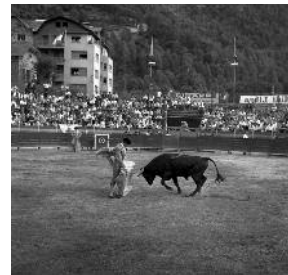
Cursa de braus a les Arenes Monumentals d'Escaldes-Engordany. FAM. Arxiu Nacional d'Andorra